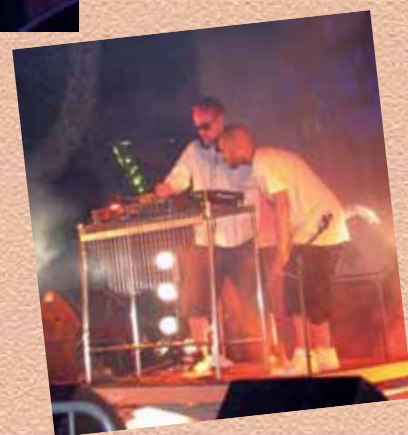
SPIKY The Machinist