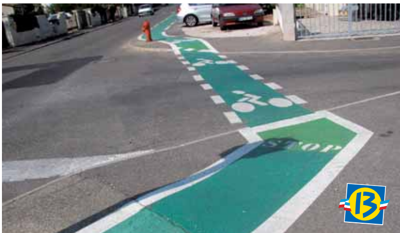
Les travaux d'aménagements ont été financés à hauteur de 80% par le Conseil Général

Dans le cadre des actions municipales en faveur du développement durable, un groupe de travail s'est penché sur la réalisation d'un nouveau maillage de bandes cyclables sur la commune. Il permettra aux cyclistes de trouver une place sécurisée aux côtés des piétons et des automobilistes.