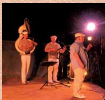
Vendredis au Jardin