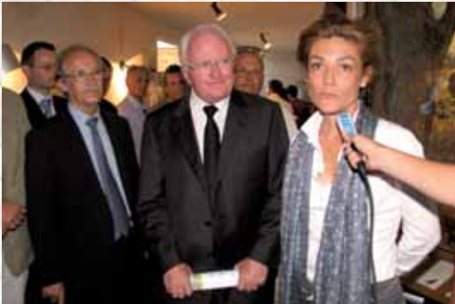
A l'Ecomusée, après la signature des conventions cadre