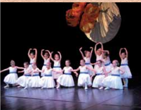
Danse Classique (CDC) le 26 juin