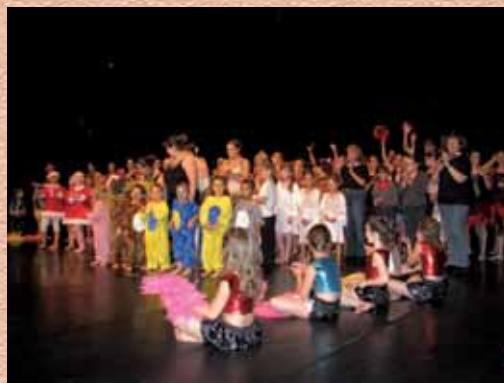
La Rythmo le 12 juin