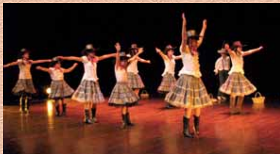
Danses d'Ailleurs : country, capoeira, salsa et danse orientale (ateliers du CDC) le 19 juin