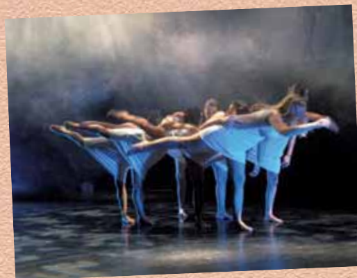
Evalt (CDC) le 11 juin