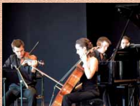
Route de la Durance aux Alpilles