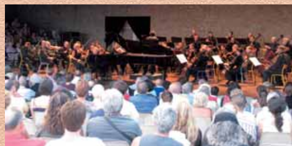
Festival International de Piano de la Roque d'Anthéron