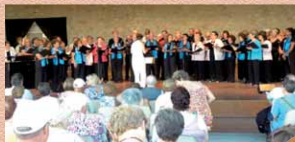
Temps des Aulnes Le Chœur Saint-Martin reçoit une chorale du Québec