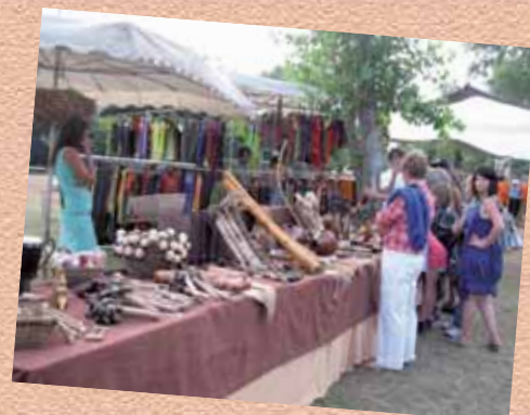
Marché artisanal "Le Village", une 1 ère pour le Festival