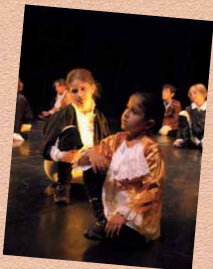
Cie Pierre de Lune le 8 juin