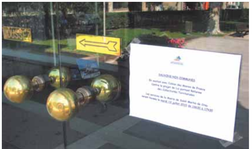
Les services au public de la Mairie ont été fermés durant 1h