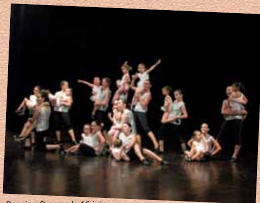
Dancing Dreams le 16 juin