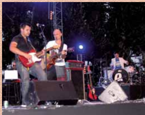
Quand la diva s'en va