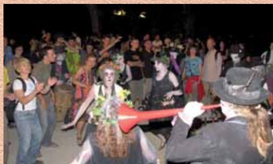
La Fanfare des Rara Woulib